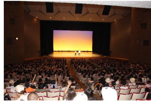
蒲郡まつり ときめきサタデー