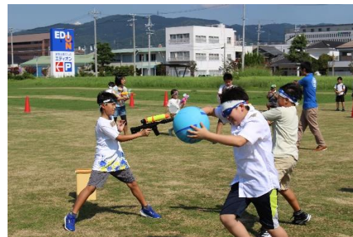
蒲郡でガチマッチ！リベンジ！！