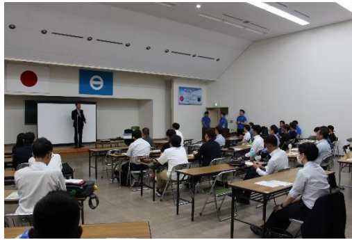
蒲郡市行政勉強会